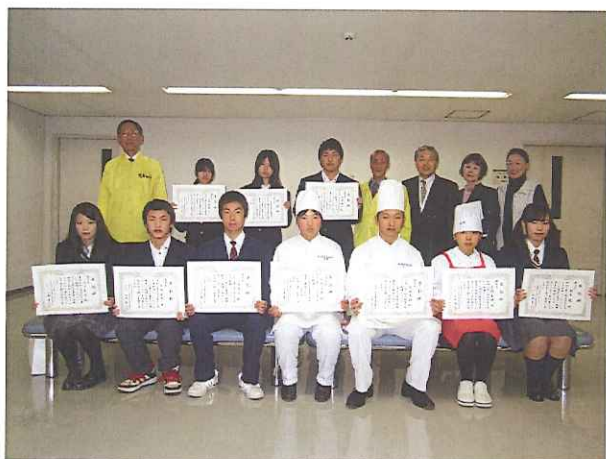
審査委員を囲んでの記念撮影